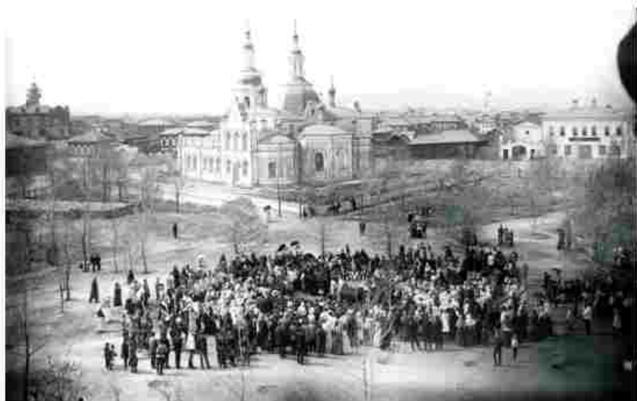
Рис. 1. Город Минусинск. Праздник древонасаждения. 8 мая 1911 г.

Жители заранее намечали совместно с городской управой, где заложить новый сад или сквер. В посадке принимали участие гимназисты, школьники вместе с родителями и учителями. При открытии скверов и садов проходил молебен. Праздник древонасаждения (как он назывался в те годы) сопровождался концертами и лотереей. На сохранившейся в музее старинной фотографии запечатлен один из моментов подобного мероприятия, состоявшегося в уездном городе Минусинске Енисейской губернии весной 1911 г. (рис. 1).